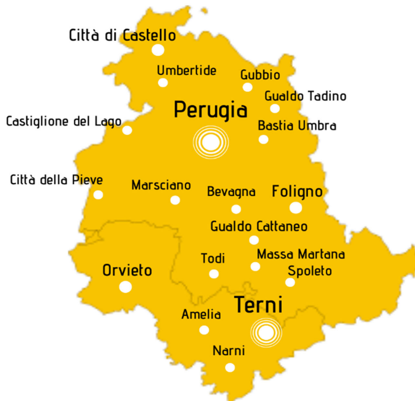
Fig. 2 Sedi ARPAL Umbria